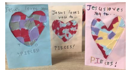
カード"Jesus loves you to pieces!"

おやこジョイクラブ は、1月27日(月)11時から開催され、0歳児と1歳児の親子、計4組が参加してくださいました。次回は 3月24日(月)午前11時から、東久留米市中央図書館 にて開催予定です。