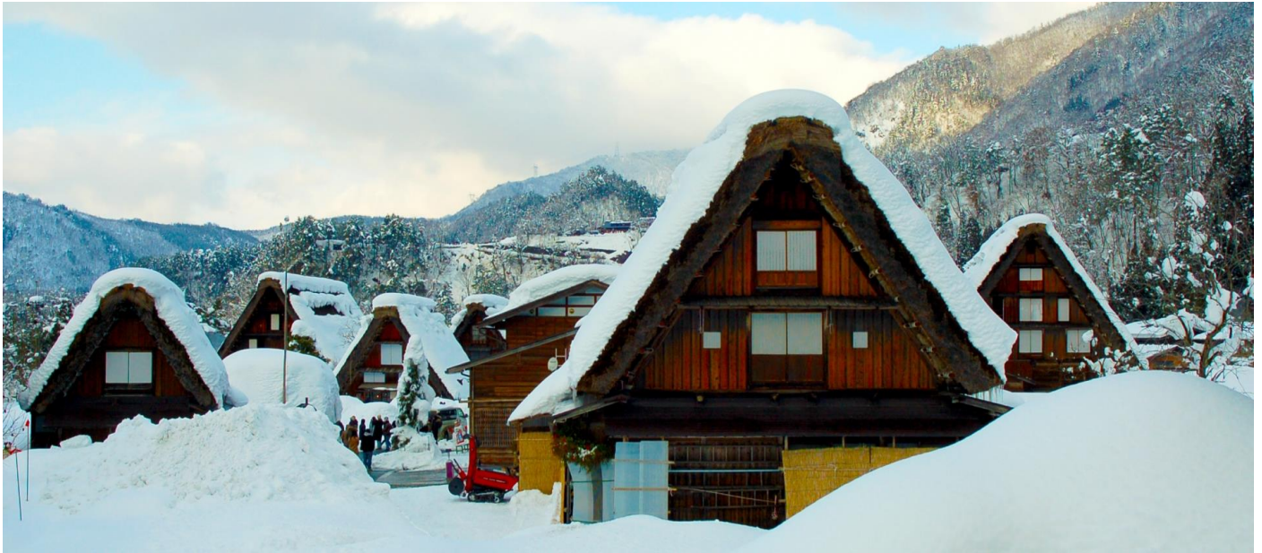
冬の白川郷 雪景色