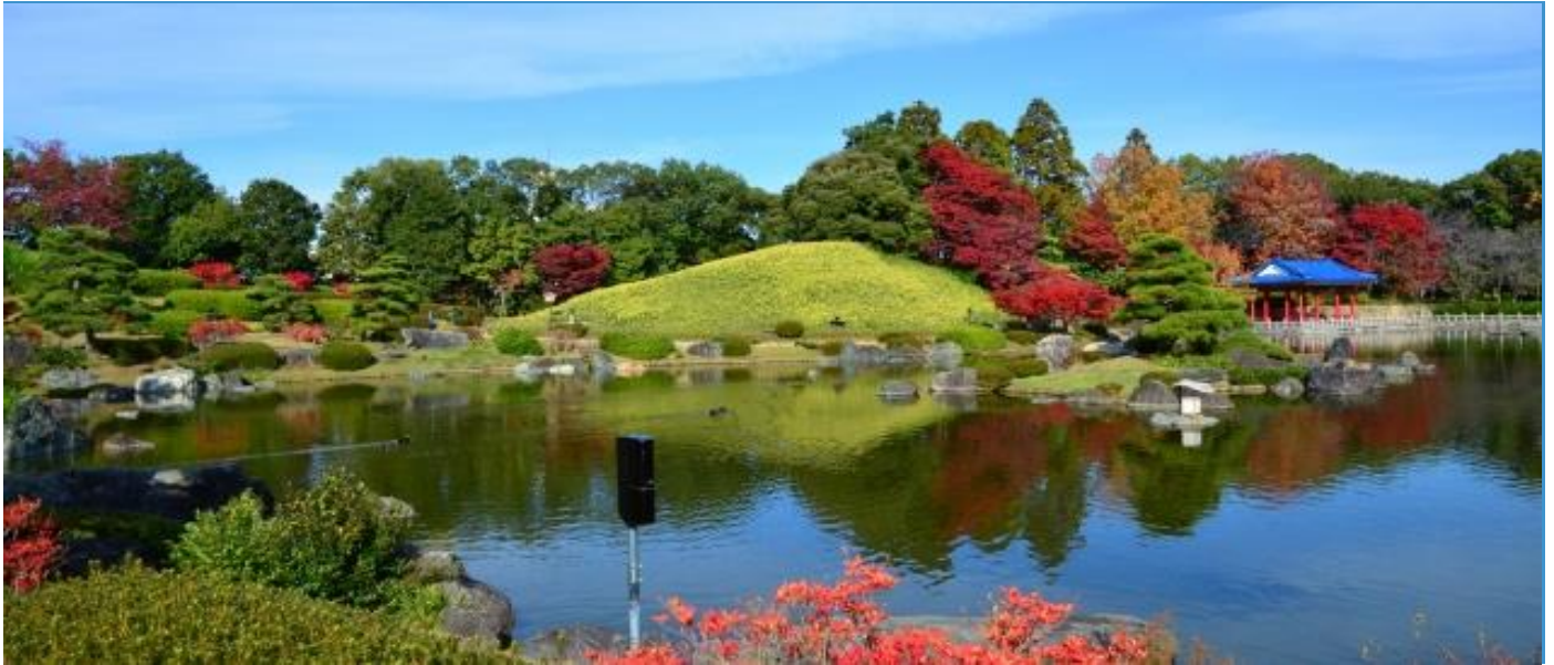
大阪府堺市の大仙公園