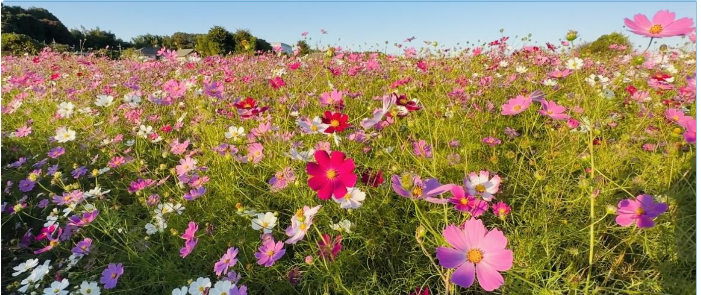
金山緑道公園コスモス畑（東京都・清瀬市）